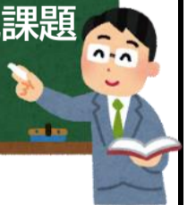
R6 生徒の授業評価 前期と後期の比較