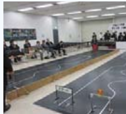
▲ロボット競技コース