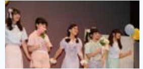
▲ファッションショー