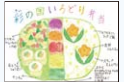
▲アイデア弁当原画 (昨年度 教育長賞)