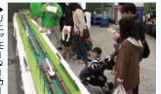
▶ リニアモーターカー