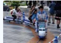
▲ミニ新幹線乗車体験